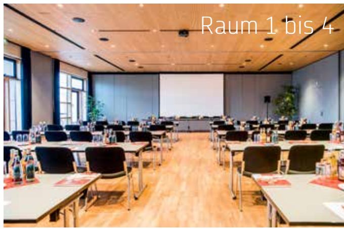
Raum 1 bis 4

Ein Haus mit vielfältigen Möglichkeiten und großzügigem Raumangebot. Flexibles Raumkonzept durch multifunktionale Raumgestaltung.