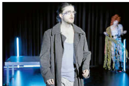
„Draußen vor der Tür“ von Wolfgang Borchert