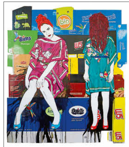
Collage auf Kartinage: „look at me“ Grafik: Danielle Zimmermann