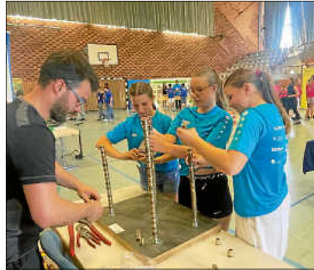
Schüler tüfteln und werkeln mit vollem Eifer

Beteiligte Firmen und Einrichtungen: Arbeitsagentur, Bürgerstiftung Bad Saulgau, Beutinger GmbH, Claas GmbH, Elektro Neher, Fahrrad Neudörffer, Gabriel GmbH, Georg Reisch GmbH, Kelch Landschaftsbau, Kleber Post, Knoll Maschinenbau GmbH, Landwirtschaftliches Zentrum Aulendorf, Schultesbeck, Zimmerei Luib.