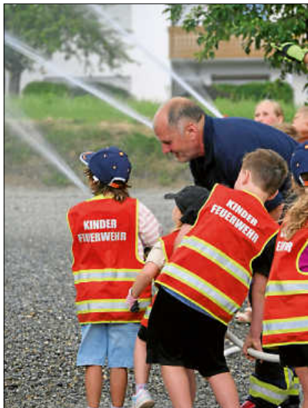
Übung der Kindergruppe

Im Namen der Ortsverwaltungen Hochberg und Lampertsweiler dankte Ortsvorsteher Gerd Fuchs allen Einsatzkräften für die Durchführung der Übung sowie ihren ehrenamtlichen Einsatz. Besonders beeindruckt zeigte er sich von der Leistung der Kindergruppe und deren hochmotivierten Kinder.