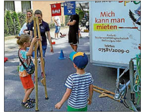
Das Spielmobil bietet tolle Outdoor-Spiele für Kinder.

Ob Kindergeburtstag, Straßenfest oder Vereinsfeier – mit dem Spielmobil wird Ihr Event auch für die Kleinen zum Erlebnis! Der Anhänger bietet eine breite Auswahl an Outdoor-Spielen, die Spaß machen und gleichzeitig Motorik, Sensorik sowie das soziale Miteinander fördern. Von Kettcars und Pedalos über Stelzen und Ballspiele bis hin zu einem Riesen-4-Gewinnt: Hier ist für jeden das Richtige dabei! Machen Sie Ihr Fest zu einem besonderen Tag für Groß und Klein – informieren Sie sich jetzt bei der Tourismusbetriebsgesellschaft Bad Saulgau unter Tel. 07581 2009-26 über Inhalt, Termine und Mietpreise.