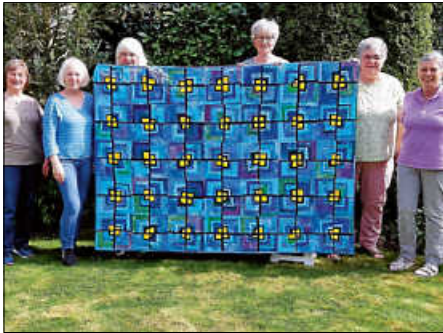
Der in liebevoller Handarbeit gefertigte Quilt 'Lichtblicke'

Allen Teilnehmer:innen wünschen wir viel Glück!