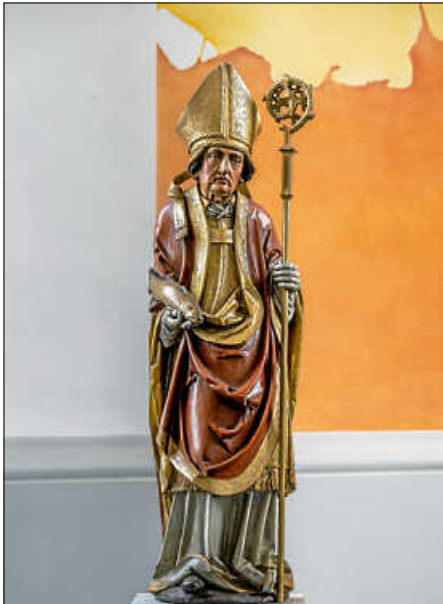
Hl. Ulrich, Pfarrkirche Fulgenstadt

Seelsorgeeinheit Sankt Johannes Baptist Bad Saulgau