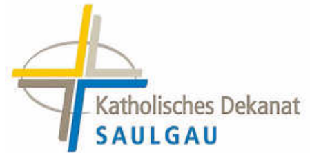
Logo: Kath. Kirchengemeinde