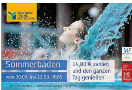
Plakat: Sonnenhof-Therme Bad Saulgau

Ein weiteres Highlight erwartet die Gäste ab 30. Juli : Bis einschließlich 13. September heißt es wieder Sommerbaden in der Sonnenhof-Therme . Für den Preis des regulären Drei-Stunden-Tarifs von 14,80 Euro können Besucherinnen und Besucher den ganzen Tag in der Therme entspannen und die wohltuende Wirkung des Thermalwassers genießen. Das Angebot ist zudem mit verschiedenen Vergünstigungen kombinierbar, beispielsweise mit Ermäßigungen der Rheuma-Liga , dem Wellpass oder der SZ-Card .