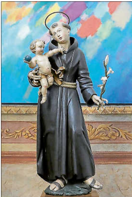
Darstellung des heiligen Antonius, 19. Jahrhundert

Seelsorgeeinheit Sankt Johannes Baptist Bad Saulgau