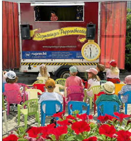
Kasperle-Theater mit Unterstützung von Bad Dürheimer