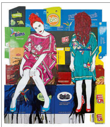
Collage auf Kartilage: „look at me“

werbung – kaum ein Bereich ist vor ihren postmodernen Übergriffen geschützt, am wenigsten sie selbst. Upcycling ist Zimmermanns wichtigster Ansatz, neben der Zeichnung, Radierung und Collage. Die Künstlerin, die an der Staatlichen Akademie der Bildenden Künste und in New York studiert hat und als weiteren Beruf gestandene Studienrätin im Fach Kunst ist, nutzt gezielt scheinbar wertlose Verpackungsmaterialien, um daraus hochkarätige Kunst zu machen: Tortenböden, Klopapier, Geschenkschleifen, Plastikmuscheln und Autoreklame treffen auf Ikonen der Zeit- und Kunstgeschichte. Vor dem Hintergrund aktueller Debatten über Bilder, Rollen und Umgänge mit der Frau in der Gesellschaft erfahrene ihre Werke eine elektrisierende, feministische Kontextualisierung. Es entsteht eine die ganze „Fähre“ überziehende Pop-Art in zeitgemäßem Kleid, betrachtet aus einer selbstbewussten, weiblichen Perspektive,