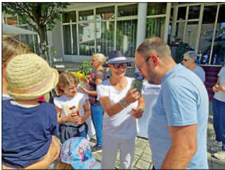
Die Passanten freuten sich über das große Mitmach-Angebot des Kneippvereins beim Happy Family Day