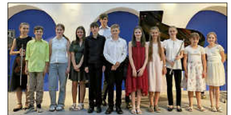
Stipendiaten des Vorjahres