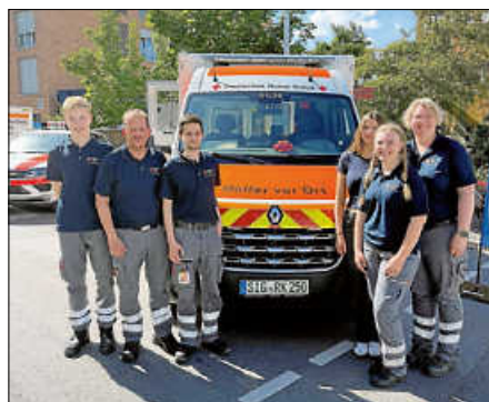
Deutsches Rotes Kreuz