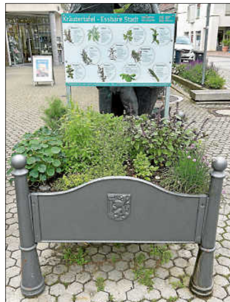
Kräuterpfanzkübel am Marktplatz

Die mit unterschiedlichen Küchen-, Tee- und Heilkräutern bepflanzten Kübel im Stadtbereich von Bad Saulgau sind nun erntebereit.