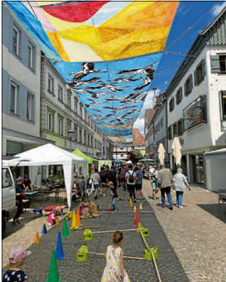
Happy Family Day 2026