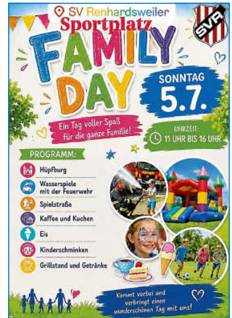
Plakat: SV Renhardsweiler