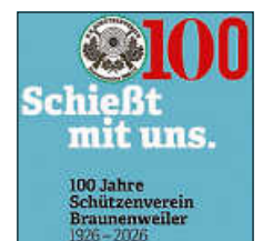
Plakat: KKSv Braunenweiler

Jeder ab 12 Jahren kann teilnehmen. Mit etwas Glück kann die begehrte Ehrenschiebe gewonnen werden, die beim Jubiläumsschießen am 27.06.2026 feierlich übergeben wird.