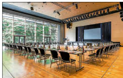
Das Stadtforum sucht Aufbau-, Abbau- und Umbau-Helfer (m/w/d)