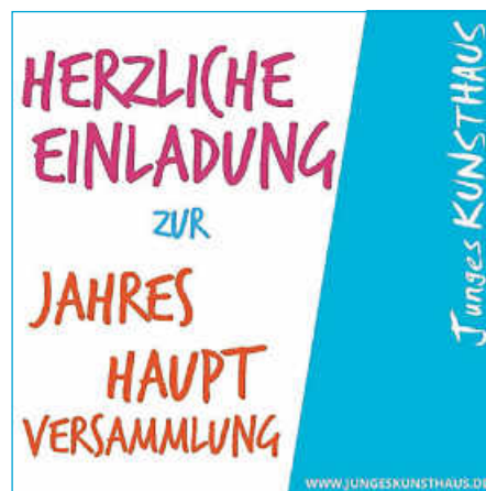
Grafik: Junges KUNSTHAUS

Junges KUNSTHAUS Kunst Theater Tanz Musik