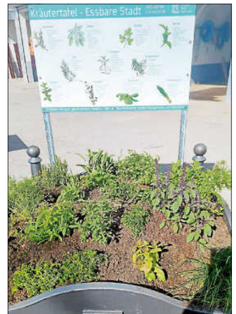
Pflanzkübel mit Kräutertafel

Die Pflanzen müssen allerdings im Moment erst noch richtig anwachsen. Daher bittet die Stadtverwaltung darum, sich noch etwas zu gedulden, vorerst noch nichts zu ernten und die Pflanzen erst einmal in Ruhe wachsen zu lassen. In etwa vier Wochen, d.h. ab KW 25, können gerne Blätter und Stängel der Pflanzen gepflückt und mitgenommen werden.