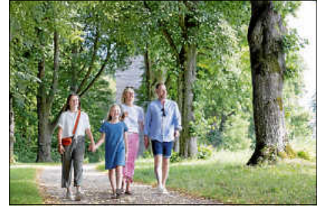
Bad Saulgau für Familien

Informationen zu allen Stadtführungen und Genusstouren, Terminen, Themen und Preisen sind online verfügbar: www.bad-saulgau-erleben.de/stadterleben/stadtfuehrungen .