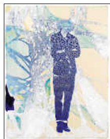
Belichtung des Jetzt, 2025. Lascau, Öl auf Leinwand