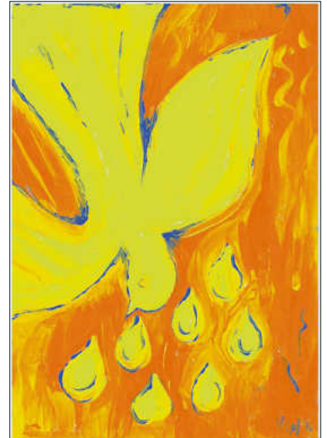
In: Pfarrbriefservice.de Grafik: Doris Hopf

Seelsorgeeinheit Sankt Johannes Baptist Bad Saulgau