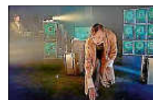
Szene Alan – Mensch Maschine

Zum Finale der diesjährigen Theatersaison am Samstag, 23. Mai 2026, darf sich das Publikum auf ein „fabelhaftes Theaterwunderwerk“ (Egbert Tholl, Süddeutsche Zeitung)