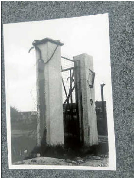
Ehemaliges Tor zum KZ-Außenlager in Dachau