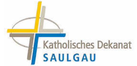
Logo: Kath. Kirchengemeinde