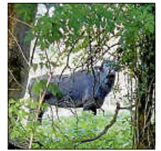
Wasserbüffel im Wasenried

Wir danken der Bevölkerung für ihr Verständnis und ihre Mithilfe beim Schutz dieses wertvollen Naturraums.