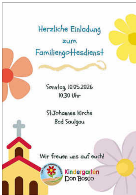
Plakat: Kindergarten Don Bosco