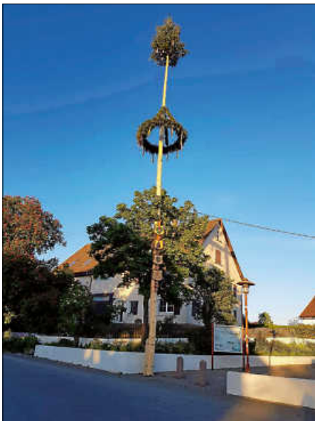
Maibaum 2026

Auch in diesem Jahr konnte wieder ein schöner Maibaum durch die Freiwillige Feuerwehr, Löschgruppe Lampertsweiler-Rieden, auf dem Kapellenplatz St. Valentin aufgestellt werden. Ein herzliches Dankeschön von der Ortsverwaltung an die Feuerwehr für das Holen, Schmücken und Aufstellen des Maibaums. Ein weiterer Dank allen, die zum Gelingen, sei es mit Fahrzeugen, Gerätschaften, Straßensperrung und Bereitstellen der Fläche für das gemütliche Zusammensein, mitgewirkt haben. Die Bewirtung der Veranstaltung wurde auch in diesem Jahr wieder von einem Freiwilligen-Team übernommen, welches den Erlös spendet. Dafür natürlich auch ein herzliches Dankeschön. Gefreut hat mich riesig, dass die Bürgerinnen und Bürger der Einladung dieser Tradition gefolgt sind, was auch wiederum für ein gutes Miteinander spricht.