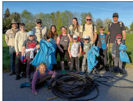
Pfadfinder Royal Ranger bei der Schwarzachtalputzete

Am Freitag, 24. April führten die Pfadfinder „Royal Rangers“ in Zusammenarbeit mit dem städtischen Umweltbeauftragten wieder ihre traditionelle Schwarzachtalputzete durch.