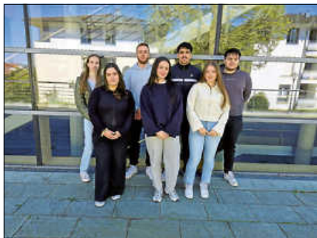
Auszubildende der Kreissparkasse Sigmaringen

Am 22.04.2026 konnten die Auszubildenden des Beratungszentrums der Hohenzollerischen Landesbank Kreissparkasse Sigmaringen im Rahmen eines Nachhaltigkeitsprojekts wertvolle praktische Erfahrungen im Umwelt- und Klimaschutz sammeln. Ein derartiges Nachhaltigkeitsprojekt ist fester Bestandteil der Ausbildung im ersten Lehrjahr.