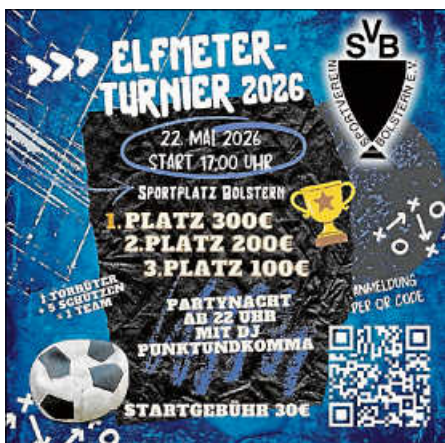
Grafik: QR-Code: automatisch generiert; Flyer Design mit Canva