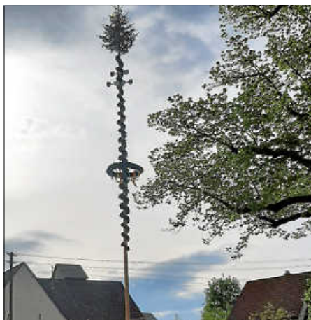
Maibaum Wolfartsweiler

Traditionell haben die Kameraden der FF-Löschgruppe Wolfartsweiler am Vorabend zum 01. Mai wiederum einen prächtigen Maibaum auf unserem Dorfplatz aufgestellt. Die Ortsverwaltung bedankt sich bei Michael Sommer für die Baumspitze und das Reisig, beim „Kranzteam“ für das aufwen-