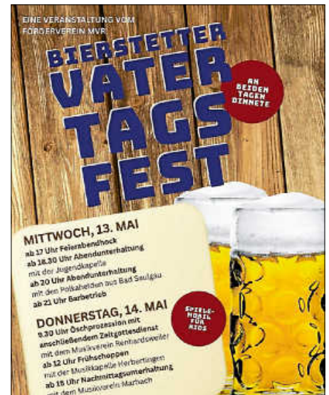
Plakat: Förderverein Musikverein Renhardsweiler