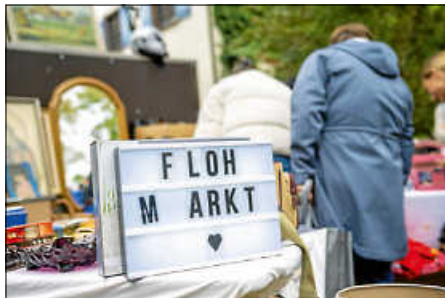
Großer Frühlingsflohmarkt mit Krämermarkt

Natürlich ist auch für das leibliche Wohl bestens gesorgt. Ein abwechslungsreiches kulinarisches Angebot lädt zum Genießen und Verweilen ein. Gut zu wissen: Der Markt findet bei jedem Wetter statt! Kommen Sie vorbei und erleben Sie einen ereignisreichen Tag für die ganze Familie!