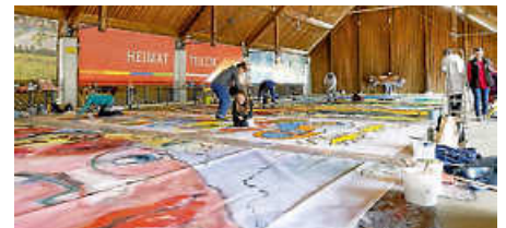
Die 3,20 x 9,50 Meter großen Stoffbanner für die Luft ART 2026 werden in der kommenden Woche in einer öffentlichen Malaktion im Parkhaus Lindenstraße bemalt

Gemalt wird im Parkhaus jeweils von 8.15 Uhr bis 16 Uhr. Dabei können auch die Künstlerinnen und Künstler kommen und gehen, wie sie wollen. Einzige Voraussetzung: Die Kunstwerke müssen bis Samstag, 9. Mai fertiggestellt sein. Denn bereits in der Folgeweche beginnt der Bauhof mit dem Aufhängen der neuen Werke.