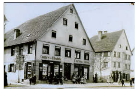
Stadtführung – Stumme Zeugen der NS-Zeit

Am Donnerstag, 7. Mai, um 18:00 Uhr , macht der Stadtpaziergang „ Stumme Zeugen der NS-Zeit “ die NS-Geschichte in Bad Saulgau erfahrbar. Die Führung führt zu Orten, Gebäuden und Straßen, die in den Erinnerungen von Zeitzeugen eine Rolle spielen. Historische Fakten und persönliche Berichte lassen die Vergangenheit der Stadt lebendig werden. Der rund zweistündige Rundgang regt zum Nachdenken an und macht wichtige Denkorte sichtbar.