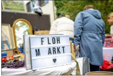
Großer Frühlingflohmarkt mit Krämermarkt

Natürlich ist auch für das leibliche Wohl bestens gesorgt. Ein abwechslungsreiches kulinarisches Angebot lädt zum Genießen und Verweilen ein. Gut zu wissen: Der Markt findet bei jedem Wetter statt! Kommen Sie vorbei und erleben Sie einen ereignisreichen Tag für die ganze Familie!