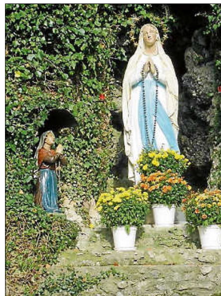
Lourdesgrotte Steinbronnen

Seelsorgeeinheit Sankt Johannes Baptist Bad Saulgau