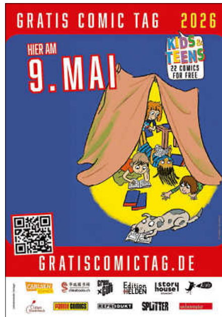
Plakat: FESTUNION GmbH

Wer nach der Aktion noch nicht genug von Comics hat, kann in der Stadtbibliothek zu den Öffnungszeiten in mehr als 300 weiteren Titeln stöbern oder diese für vier Wochen ausleihen.