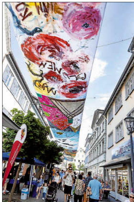
Am ersten Juniwochenende finden wieder die Happy-Summer-Night und der Happy-Family-Day statt

Jetzt schon vormerken: Bad Saulgau lädt am ersten Juniwochenende 2026 zu zwei besonderen Veranstaltungen in die Innenstadt ein. Am Samstag, 6. Juni , begeistert die Happy-Summer-Night als stimmungsvolles Open-Air-Musikfest, gefolgt vom Happy-Family-Day am Sonntag, 7. Juni , dem großen Umwelt- und Familientag.