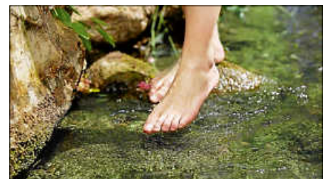
Wassertreten ist eine wahre Wohltat

Am Sonntag, den 19. April ist es endlich wieder so weit: Dann beginnt auch in Bad Saulgau wieder die Kneipp-Saison im schönen Kurgarten. Treffpunkt ist um 10 Uhr im dortigen Eingangsbereich. Hierzu lädt der Kneippverein Bad Saulgau alle Interessierten herzlich ein, auch gerne Kinder und ihre Eltern, Großeltern oder andere Begleitpersonen.