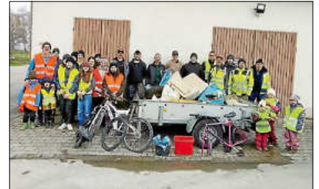
Die fleißigen Helfer

Die Vorstandschaft des Freizeit-, Heimat- und Brauchtumsvereins Moosheim bedankt sich bei den fleißigen Helfern der Feld-, Wiesen- und Waldputzete. Auch ein herzliches Dankeschön an den Bauernverband BC-SIG und an die Ortsverwaltung Moosheim für den finanziellen Zuschuss für das Helfervesper.