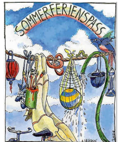
Grafik: Hendrike Kösel

Auch in diesem Jahr wird das Team des Kinder- und Jugendbüros Haus Nazareth gemeinsam mit vielen ehrenamtlichen Kräften den Kindern und Jugendlichen im Rahmen des Sommerferienspaßes ein abwechslungsreiches Programm bieten. Für die Gestaltung eines attraktiven und vielseitigen Ferienprogramms sind neue ehrenamtliche Helfer*innen herzlich willkommen. Egal, ob Kochen, Backen, Basteln oder sportliche Aktivitäten, der Kreativität und dem Ideenreichtum sind hierbei keine Grenzen gesetzt. Meldezettel für die Angebote können entweder per E-Mail ( sommerferienspass.bad-saulgau@haus-nazareth-sig.de ) oder persönlich im Kinder- und Jugendbüro, Schützenstraße 28, abgeholt werden. Der Abgabetermin für die Meldezettel ist spätestens am Montag, 27. April 2026 . Bei Rückfragen stehen die Mitarbeiter*innen des Kinder- und Jugendbüros unter der Tel. 07581 527583 zur Verfügung.