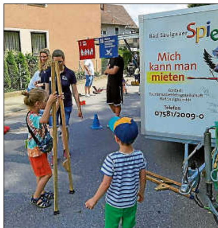
Das Spielmobil bietet tolle Outdoor-Spiele für Kinder.

Wir sorgen dafür, dass Ihre Feier in Bewegung bleibt!