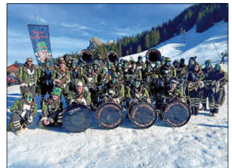
Die Sulgerner Löchligugger e.V. bei ihrem Vereinsausflug in Mellau.

Besonders freuen sich die Sulgerner Löchligugger natürlich auch über musikalisch Interessierte, die nicht nur zuhören, sondern direkt mitmachen möchten . Wer ein Instrument spielt und Lust auf Guggenmusik, Gemeinschaft und gute Stimmung hat, ist herzlich eingeladen, einfach vorbeizukommen und mitzuspielen. Ob zum Reinschnuppern, Zuhören oder Mitmachen – die Sulgerner Löchligugger freuen sich auf viele neugierige Besucherinnen und Besucher und auf einen unterhaltsamen Nachmittag in Braunenweiler.