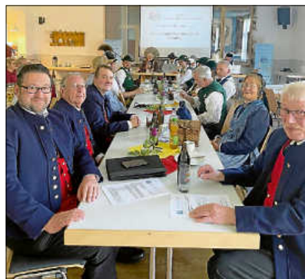
Saulgauer Trachtendelegation bei der BSG Hauptversammlung

Trachtenverband in Lindau, erhielten die Saulgauer Trachtler den Zuschlag zur Ausrichtung eines Gautrachtenfestes 2028. Wie kam es dazu? 2028 jährt sich die Ausgliederung der Trachtengruppe aus der Dorausunft Saulgau zum 50. Mal (die Trachtengruppe existiert bereits seit dem Jahr 1954 und war bis zur Ausgliederung im Jahr 1978 die „Trachtengruppe der Dorausunft“). Am 02.06.1978 wurde im Gasthaus Kreuz, aus dieser Gruppe heraus, der Heimat- und Trachtenverein Saulgau e.V. aus der Taufe gehoben. Dieses 50-jährige Jubiläum wird nun mit einem Gautrachtenfest am 30.09./01.10.2028 ganz groß gefeiert. Seit dem 28.04.1974 gehören die Saulgau Trachtler dem Bodensee-, Heimat- und Trachtenverband an. Ein Dachverband bestehend aus aktuell 20 Vereinen mit ca. 1500 Mitglieder und 120 Kinder/Jugendlichen und einem Verbreitungsgebiet aus Vereinen von Oberschwaben, Allgäu und Bodensee bis hin nach Villingen im Schwarzwald.