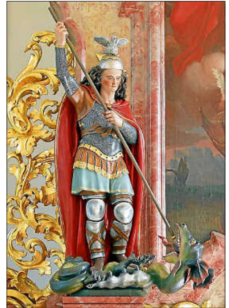
Darstellung des Heiligen Georg von Hermann Stärk in der Kapelle in Untereggsweiler

Text: Basilika und Wallfahrtsort Vierzehnheiligen