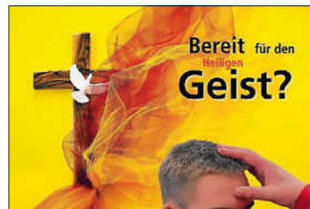
Grafik: Dennis Mangold

In den Gottesdiensten zur Erstkommunion in Bolstern, Fulgenstadt, Hochberg und Renhardsweiler bitten wir um eine Spende für die Diaspora.