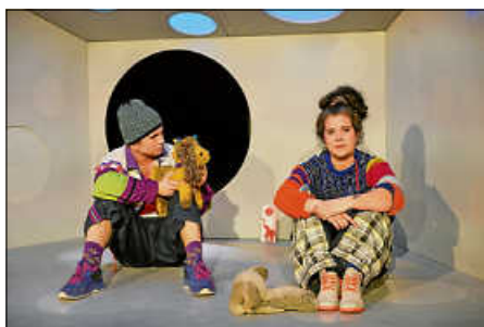
Löwenherzen – ein Stück zu Weihnachten für die ganze Familie

Erstmals bietet das Theaterprogramm der Stadt Bad Saulgau ein Kindertheater für die ganze Familie nach Weihnachten an: Eingeladen ist das Landestheater Tübingen mit dem starken Stück „Löwenherzen“. Es ist besonders geeignet für Kinder ab 8 bis 12 Jahren. Denn scharfsinnig und mit hoher Emotionalität erzählt „Löwenherzen“ von Kindern, die allen Widrigkeiten zum Trotz Mut beweisen und für sich und andere eintreten. Geschrieben wurde das Stück von der georgisch-deutschen Theaterregisseurin, Dramatikerin und Romanautorin Nino Haratischwili, der es gelingt, ein Kaleidoskop unterschiedlicher Schicksale zu erzählen, in denen sichtbar wird, wie alles in der Welt miteinander verbunden ist.