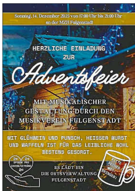
Adventsfeier in Fulgenstadt

Dienstzeiten: Montag, 17.30 - 19.30 Uhr oder nach Vereinbarung