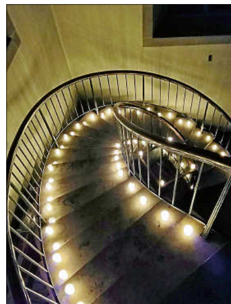
Aufgang zur Empore in der Stadtpfarrkirche

Die Kollekten sind an diesem Sonntag für die Aufgaben in den Pfarrgemeinden bestimmt.