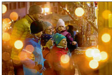
Sulgemer Advent im Oberamteihof