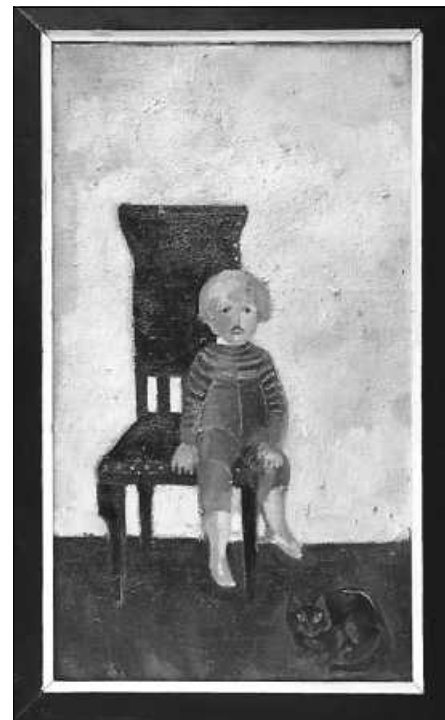
Tobias auf dem Stuhl Plakat: Edith Kösel

Die Ausstellung ist jeweils dienstags bis sonntags zwischen 14 und 17 Uhr geöffnet. Auch die samstäglichen Stadtführungen machen jeweils Halt in der Ausstellung.