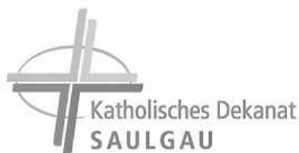
Logo: Kath. Kirchengemeinde