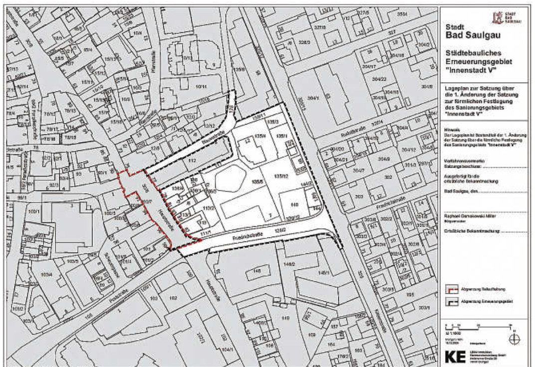
Abgrenzungsplan – Teilaufhebung rot markiert