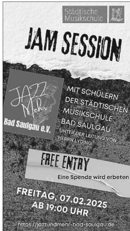
Offizielles Plakat der Jam-Session 2025 mit der Städtischen Musikschule Bad Saulgau Plakat: Stephanie Fritzer