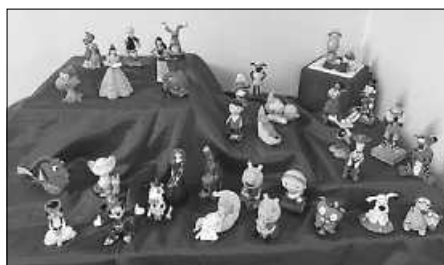
Neue Tonies in der Stadtbibliothek

Insgesamt kann in der Stadtbibliothek aus rund 200 Tonies ausgewählt werden, so dass abwechslungsreiche Unterhaltung für die kleinen und großen Besucherinnen und Besucher garantiert sein dürfte.