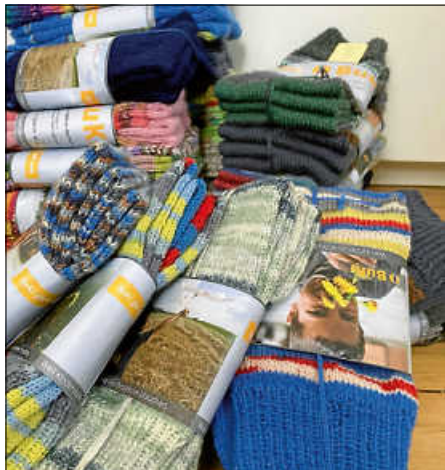
Mit viel Liebe gestrickt, die Handstricksocken von BuKi.