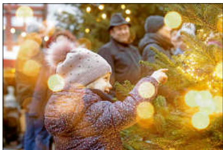
Sulgerner Advent

Nach dem gelungenen Auftakt öffnet der neue Sulgerner Advent auch am zweiten Adventswochenende seine Hütten im Oberamteihof. Das neue Adventsformat ersetzt das frühere Weihnachtsdorf auf dem Marktplatz und schafft – gemeinsam mit Schulen, Vereinen, Gastronomie und engagierten Bürgerinnen und Bürgern – einen persönlichen und atmosphärischen Rahmen für die Vorweihnachtszeit.