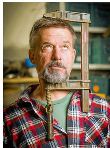
Uli Boettcher gastiert im Stadtforum

Tickets sind erhältlich unter www.reservix.de , in der Touristinfo Bad Saulgau sowie an allen Reservix-Vorverkaufsstellen. Alle Infos zu den MUNDART-Tagen: www.bad-saulgau-erleben.de/mundart-tage