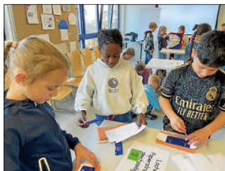
Gemeinsam im SfZ