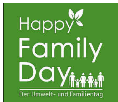
Plakat: Stadt Bad Saulgau