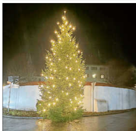
Alfons Reuter Foto: Weihnachtsbaum

Die Ortsverwaltung bedankt sich herzlich bei der Löschgruppe Tissen-Moosheim