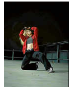
Tanzspecial im Jugendhaus Underground

Das Jugendhaus Underground bietet gemeinsam mit dem Jungen Kunsthaus ein Tanzspecial an. Dieses Special findet am Freitag, 16. Mai jeweils von 19.00 bis 20.00 Uhr im Jugendhaus statt. Das Jugendhaus hat an beiden Terminen wie gewohnt von 18.00 bis 21.00 Uhr geöffnet.