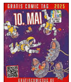
Grafik: FESTUNION GmbH

Und wer nach der Aktion noch nicht genug von Comics hat, kann in der Stadtbibliothek zu den Öffnungszeiten in mehr als 300 weiteren Titeln stöbern oder diese für vier Wochen ausleihen.