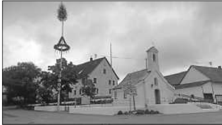
Maibaum am Kapellenplatz

haben. Die Bewirtung der Veranstaltung wurde in diesem Jahr von dem Weihnachtshütte-Team übernommen, welches den Erlös an einen gemeinnützigen Zweck spendet. Dafür natürlich auch ein herzliches Dankeschön. Gefreut hat mich riesig, dass die Bürgerinnen und Bürger der Einladung dieser Tradition gefolgt sind, was auch wiederum für ein gutes Miteinander spricht.