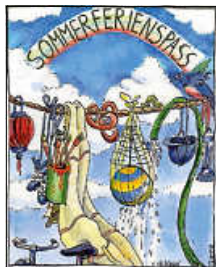
Grafik: Hendrike Kösel

Auch in diesem Jahr wird das Team des Kinder- und Jugendbüros Haus Nazareth gemeinsam mit vielen ehrenamtlichen Kräften den Kindern und Jugendlichen im Rahmen des Sommerferienspaßes ein abwechslungsreiches Programm bieten. Auch in diesem Jahr sind neue freiwillige Helfer*innen bei der Gestaltung eines attraktiven und vielseitigen Ferienprogramms herzlich willkommen. Egal, ob Kochen, Backen, Basteln oder sportliche Aktivitäten, der Kreativität und dem Ideenreichtum sind hierbei keine Grenzen gesetzt. Meldezettel für die Angebote können entweder per E-Mail sommerferienspass.bad-saulgau@haus-nazareth-sig.de oder persönlich im Kinder- und Jugendbüro, Schützenstraße 28, abgeholt werden. Der Abgabetermin für die Meldezettel ist spätestens am Montag, 12.05.2025 . Bei Rückfragen stehen die Mitarbeiter*innen des Kinder- und Jugendbüros unter der Tel. 07581 527583 zur Verfügung.