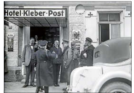
Vor 80 Jahren, am 8. Mai 1945, endete der Zweite Weltkrieg. Bad Saulgau gehörte in den Folgejahren zur französischen Besatzungszone.

in die städtische Galerie „Fähre“ ein. Im Zentrum stehen Erfahrungen und Gedanken junger und älterer Menschen, ob und wie aus der Geschichte gelernt werden kann. Welche Strategien gibt es? Welche sind für wen warum wichtig? Wie soll sich heute eine Stadt dafür engagieren?