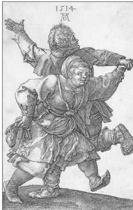
Ein nach links tanzendes Paar (Blatt 9 aus der Folge: Das Bauernfest) 1537 Staatsgalerie Stuttgart Graphische Sammlung Foto: Sebald Beham

lerischen, technischen und theologischen Innovationen des frühen 16. Jahrhunderts sowie dem emanzipatorischen Potential gedruckter Bilder. Bertram Kaschek: „Wie die Reformation ist auch der Bauernkrieg nicht denkbar ohne die Medienrevolution, die von der Erfindung der Druckpresse ausgelöst wurde. Texte und Bilder konnten nun in bislang ungekannter Geschwindigkeit vervielfältigt und verbreitet werden – und auf diese Weise auch maßgeblich zur Dynamik sozialer Bewegungen beitragen.“ Bertram Kaschek wirkt seit Oktober 2021 als Kurator für Deutsche und Niederländische Kunst vor 1800 und Fotografie an der Graphischen Sammlung der Staatsgalerie Stuttgart und entwickelte dort zuletzt die Ausstellung „Wir wölln frei sein! Druckgraphik aus der Zeit des Bauernkriegs“.