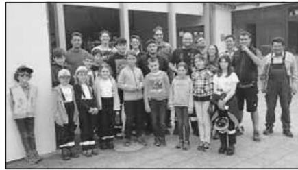
Freiwillige Helfer voll motiviert vor dem Start zur Feld-Wald-Wiesenputzete

Bedanken möchte sich die Ortsverwaltung bei allen Großen und Kleinen, die geholfen haben und sich anschließend im Dorfgemeinschaftshaus noch bei Vesper und Getränken stärken konnten.