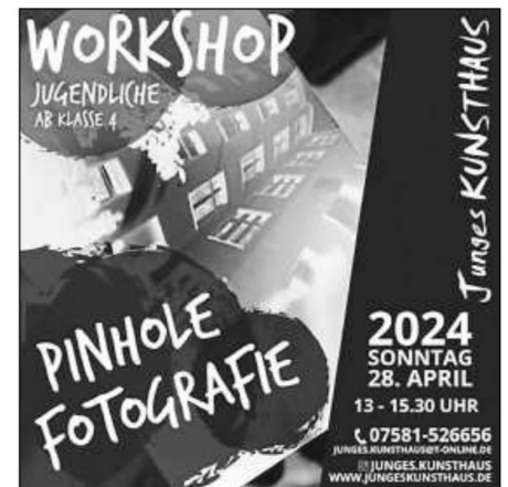
Plakat: Junges KUNSTHAUS/Rainer Leyk

Du hast Lust, eine eigene Lochkamera selbst zu bauen, Fotos auf echtem Fotopapier aufzunehmen und anschließend zu entwickeln? Dann melde dich zu diesem Workshop anlässlich des „Worldwide Pinhole Photography Day“ an! Schritt für Schritt zeigt der erfahrene Fotograf und Künstler Rainer Leyk, wie eine Lochkamera gebaut wird. Dabei bekommst du auch ein grundlegendes Verständnis über die Funktionsweise einer Kamera und anschließend hast du die Möglichkeit, das Junge KUNSTHAUS und die Umgebung