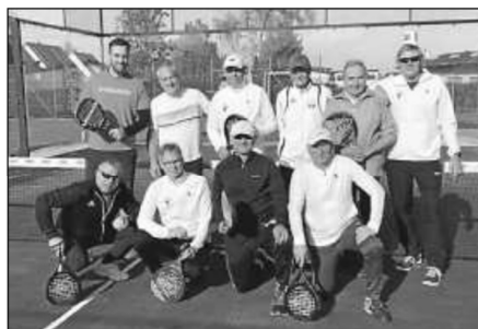
Die Experten des TC Bad Saulgau vor der neu installierten Padelanlage