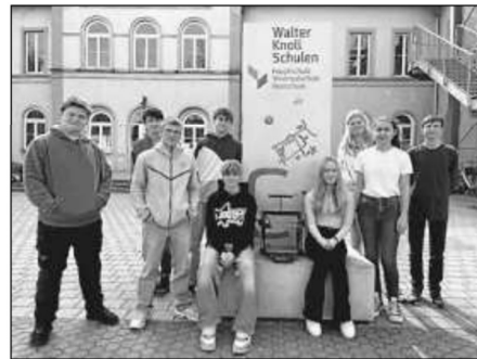
Schülerinnen und Schüler der Innovativ-AG mit dem neuen Drucker