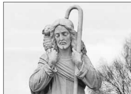
In: Pfarrbriefservice.de Foto: Myriams-Fotos/cc0-gemeinfrei/ Quelle pixabay.com

Seelsorgeeinheit Sankt Johannes Baptist Bad Saulgau