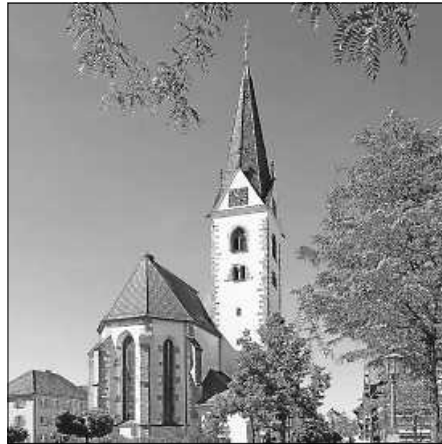
Stadtpfarrkirche Bad Saulgau