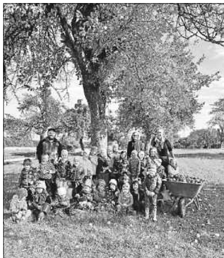
Kindergartenkinder und Erzieher bei der Apfellese

Einen herzlichen Dank an Familie Gruber für die großzügige Spende.