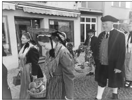
Prozession mit Brot- und Weinkorb

Am ersten Oktoberwochenende fand in Bad Saulgau die Erntedankfeier statt. Bereits zum 45. Male gestaltete der Heimat- und Trachtenverein diese Feier mit der über 200 kg schweren Erntekrone mit. Neu war in diesem Jahr, dass sich die Trachtler Freunde und Ehrengäste, darunter das Trachtenpaar aus Mengen, das Kommando der Bürgerwache, eine Abordnung des Soldaten- und Bauerntröss zu Saulgau sowie das Präsidium des Bürgerausschusses eingeladen hatten. Auch die Kinder des Kindergartens St. Josef, welche am Vortag bei der Gestaltung des Erntealtars fleißig mitgeholfen hatten, durften an der feierlichen Prozession mitmarschieren.