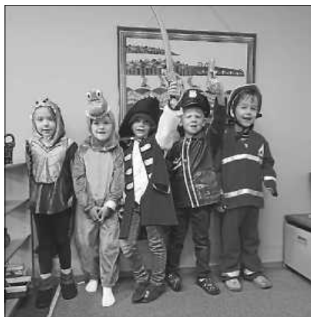
Kindergartenkinder mit ihrer neuen Verkleidung

Der Elternbeirat und der Kindergarten freuen sich wieder auf viele VerkäuferInnen und EinkäuferInnen.