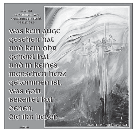
Bildkomposition: Martin Manigatterer, Gemälde von Elke Frommhold, in: Pfarrbriefservice.de

Seelsorgeeinheit Sankt Johannes Baptist Bad Saulgau