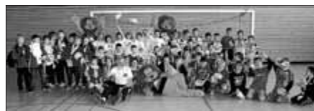
Gruppenbild mit Raubtieren: Die sechs Mannschaften der Kreisfinalrunde um den "3-Löwen-Cup" jubeln in der Bad Saulgauer Kronriedhalle mit den drei Löwen.

Im Rahmen von "Jugend trainiert für Olympia" der Klassenstufen drei und vier für Mädchen und Jungen im Bereich Fußball müssen die Teams auch beweisen, dass sie nicht nur sportliche, sondern auch kreative Treffer landen können: Jede Mannschaft musste eine eigene Fahne gestalten. Die Bad Saulgauer Viertklässler zeigten großen Einfallsreichtum - doch sportlich reichte es für die Gastgeber der Kreisfinalrunde "nur" auf Platz 4. Auf Platz 3 landeten die Grundschüler aus Mengen; die Plätze 5 und 6 belegten die Geschwister-Scholl-Schule Sigmaringen und die Nachbarschaftsgrundschule Schwenningen.