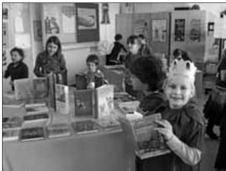
Klasse 4 der GS Renhardsweiler

Vergangenen Freitag veranstalteten Schüler, Lehrer und Eltern der Grundschule Renhardsweiler zusammen mit Frau Eisele von der Schwaaz-Vere-Buchhandlung eine Buchausstellung mit Schülerpräsentationen. Mit Liedern, Gedichten und englischen Theaterstücken läuteten die Grundschüler den Frühling ein. Anschließend besuchten die Schüler mit ihren Familien die Buchausstellung. Die Grundschüler wünschten sich sehr, dass ihre Schulbücherei weiterhin mit neuen und spannenden Büchern wachsen wird. Alle waren sich einig: Lesen macht Spaß!