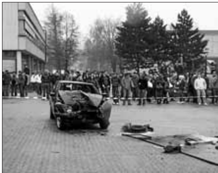
Verunfalltes Fahrzeug mit total eingedrückter Frontpartie, wieder auf allen vier Rädern stehend

Die Veranstalter sind mit dem Ablauf und dem Ergebnis der Verkehrssicherheitswoche sehr zufrieden. Man merkte, dass die Schüler mit Interesse an den verschiedenen Programmpunkten teilnahmen. Alle äußerten sie Hoffnung, dass die Eindrücke noch lange nachhaltig in den Köpfen vorhanden bleiben.