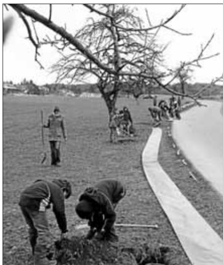
Dieses Bild zeigt den Zaunaufbau in Hochberg.

Im Hochberger Ried am Gemeindeverbindungsweg Lampertweiler-Hochberg waren am Freitag, 13.3.2009, die Pfadfinder Royal Rangers mit dem BUND, Hermann Engler und dem städtischen Umweltbeauftragten aktiv. Sie halfen, einen 350 Meter langen Zaun aufzubauen und haben sich auch für die Leerung der Eimer an einigen Tagen der Woche bereit erklärt. Wer noch bei der Eimerleerung helfen möchte, kann sich beim BUND, Tel. 8407, melden.