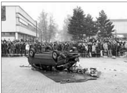
Verunfalltes Fahrzeug mit eingedrückter Frontpartie, wieder auf dem Kopf liegend, und Baumstamm