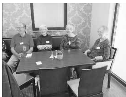
Mitwirkende Fotos: Gerhard Geiger