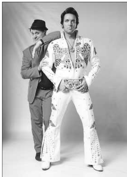
Elvis trifft Elvis

Infos zum gesamten Programm und den Corona-Regelungen sowie Karten erhalten Sie bei der Tourist-Information in der Hauptstraße 56, 88348 Bad Saulgau, Tel. 07581 2009-15 . Weitere Vorverkaufsstellen: Schwäbische Zeitung, das Ticketportal www.reservix.de sowie alle weitere Reservix-Vorverkaufsstellen.