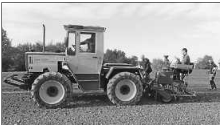
Mittels einer Spezialsämaschine mit 1,5 Meter Breite wurden im NaturThemenPark verschiedene Ur- und aktuelle Getreidearten für einen weiteren Schaugarten ausgesät.

„Nun muss es nur noch wachsen. Sind wir gespannt, was nächstes Frühjahr und nächsten Sommer dabei rauskommt“, sagen Müntz und Lehenherr. Erklärungsstafeln für die einzelnen Arten und Sorten und ihre Besonderheiten werden im Moment vom städtischen Umweltamt entworfen.