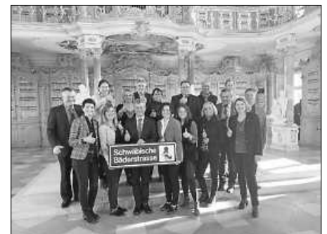
Übergabe der Geschäftsstelle