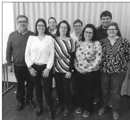
Die neu gewählte Vorstandschaft.