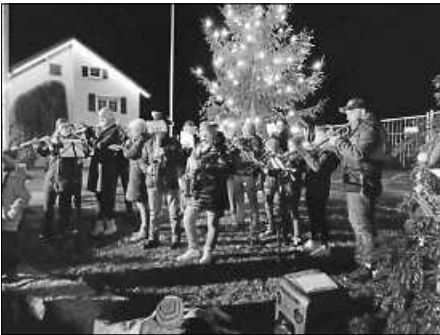
Das Weihnachtsorchester begeistert die Besucher bei der ersten Dorfweihnacht in Bogenweiler.

weiler kreativ und kulinarisch auf die Advents- und Weihnachtszeit einstimmen. Der Dorfplatz wurde schön hergerichtet, die Hütten festlich geschmückt. Besondere Highlights waren der Auftritt des Kinderchors, der mit schwungvollen Liedern rund um Advent und Weihnachten die Besucher begeisterte, sowie der Auftritt des eigens für die Dorfweihnacht zusammengefundenes Weihnachtsorchesters. Ein herzliches Dankeschön geht an alle Helferinnen und Helfer, die zum Gelingen der ersten Dorfweihnacht beigetragen haben. Ein besonderer Dank gilt dem Kinderchor sowie dem Weihnachtsorchester für die tollen Auftritte sowie der Obstbau Ummerhofer & Diesch für die Bereitstellung der Hütten.