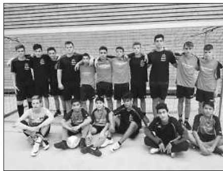
Die Teams des Schulverbundes