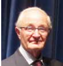
Ein paar Worte von Jean-Claude Maury, Bürgermeister von Chalais von 2008 bis 2020.

Ich bin gerade aus dem Amt des Bürgermeisters von Chalais ausgeschieden, aber ich fühle mich den großen Institutionen, mit denen ich während meiner beiden Mandate das Vergnügen hatte, mich auszutauschen, weiterhin verbunden. Bad Saulgau gehört natürlich dazu, und ich habe eine besondere Sympathie für alle Menschen, die ich getroffen habe, und vor allem für das Rathaus und die Städtepartnerschaft.