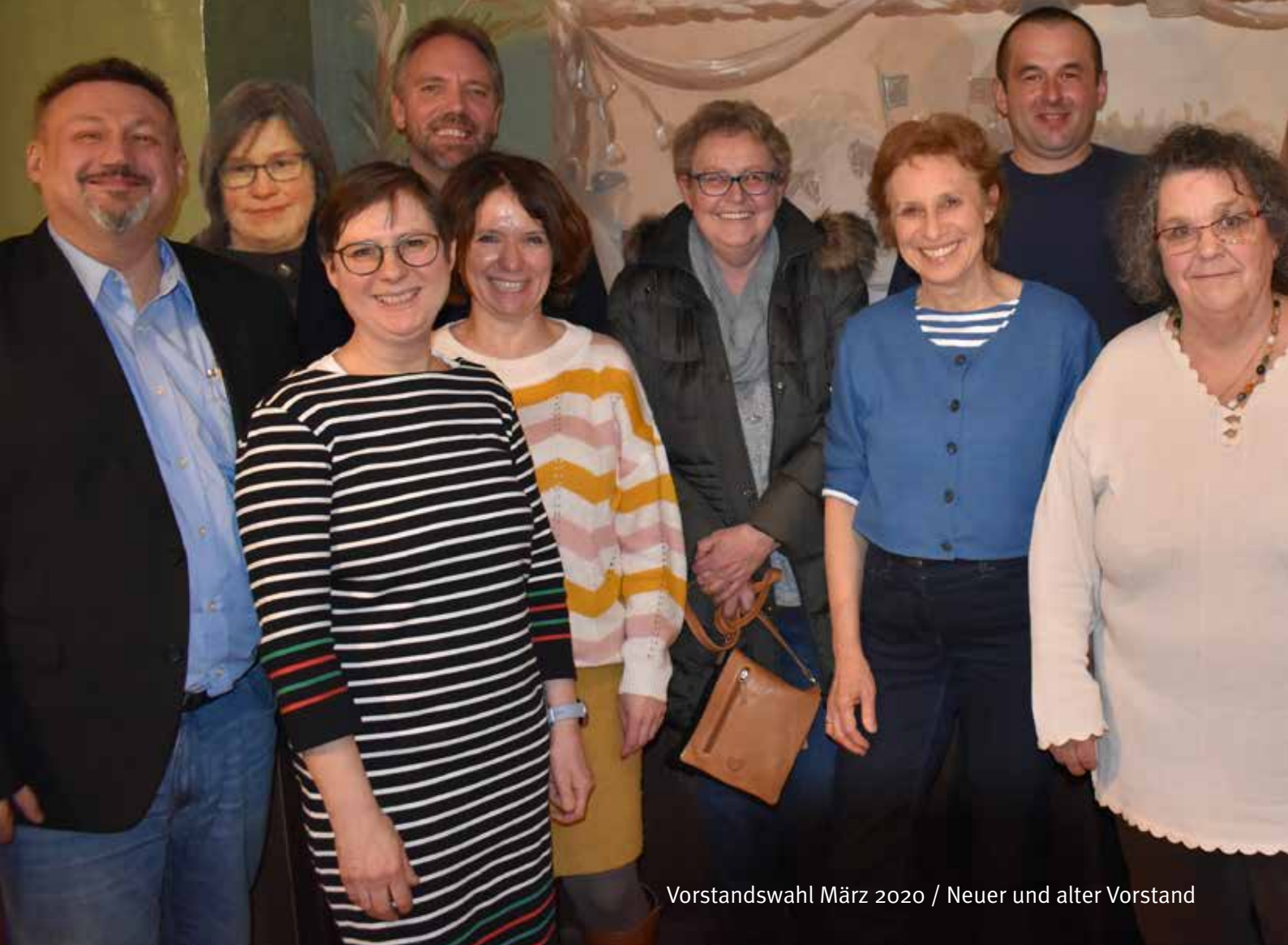
Vorstandswahl März 2020 / Neuer und alter Vorstand