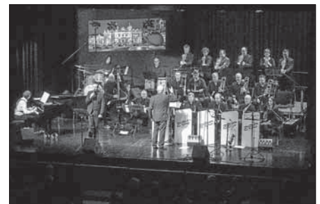
Die Big Band Saulgau präsentiert beim Jahreskonzert die ganze Welt der gesun- genen Bigband-Musik.