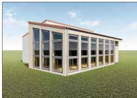
Darstellung: Mauch + Offner

Hintergrund für den Beginn mit der Multifunktionshalle ist die Zuschusssituation. Für die gesamte Generalsanierung rechnet die Stadt im Augenblick mit Kosten von über 5,5 Millionen Euro für jedes der beiden Schulgebäude. Die Sanierung soll deshalb in Bauabschnitten in Abhängigkeit von technischen Erfordernissen und der Finanzierung in Verbindung mit der Zuschusssituation erfolgen.