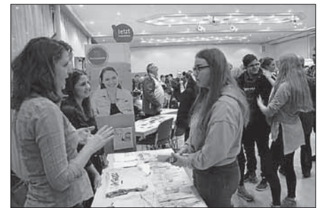
Reges Interesse beim Dating mit Bildungspartnern des Schulverbundes

Der Schulverbund bedankt sich auf diesem Weg bei allen Bildungspartnern für die außergewöhnliche Kooperation und freut sich auf weitere gemeinsame Projekte in der Zukunft.